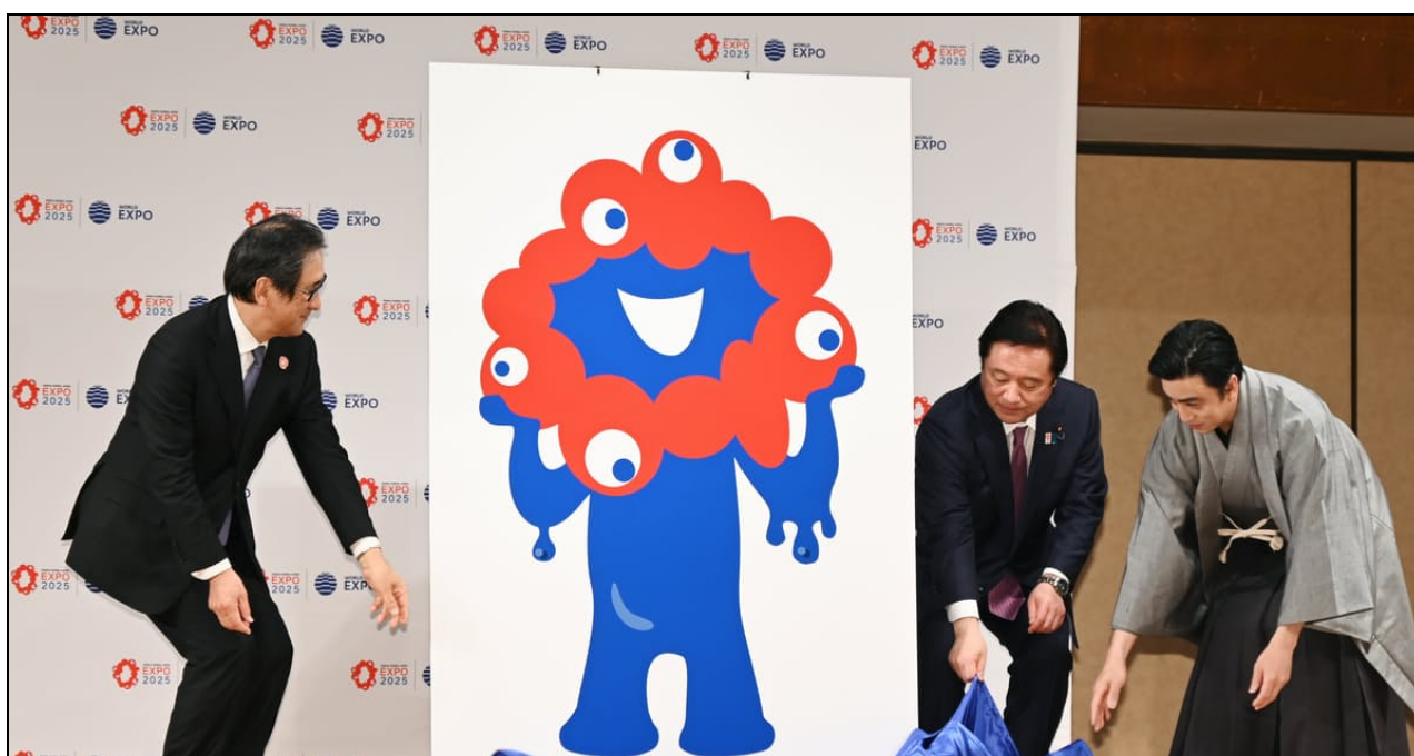
Рис. 2. Презентация 22 марта 2022 г. официального талисмана всемирной выставки Expo-2025, г. Осака.

«вложен» в руки «водяного» существа. Так создатели образа замыслили объединить эмблему Expo 2025 с водной тематикой 8 , поскольку г. Осака традиционно именуется «городом воды» 9 (рис. 2). Уже в июле 2022 г. в Японии прошли мероприятия, посвящённые тому, что до открытия Expo-2025 в г. Осака осталось 1000 дней. По этому случаю в Токио премьер-министр Кисида Фумио заявил, что Японии необходимо преодолеть серьёзные проблемы, с которыми она сталкивается дома и за рубежом, такие как пандемия коронавируса и конфликт в Украине. Он сказал, что хочет использовать выставку как возможность для Японии взять на себя инициативу в решении ряда социальных проблем с помощью самых современных технологий 10 . Выставка Expo 2025 Osaka Kansai пройдёт с 13 апреля по 13 октября 2025 г. в г. Осака.