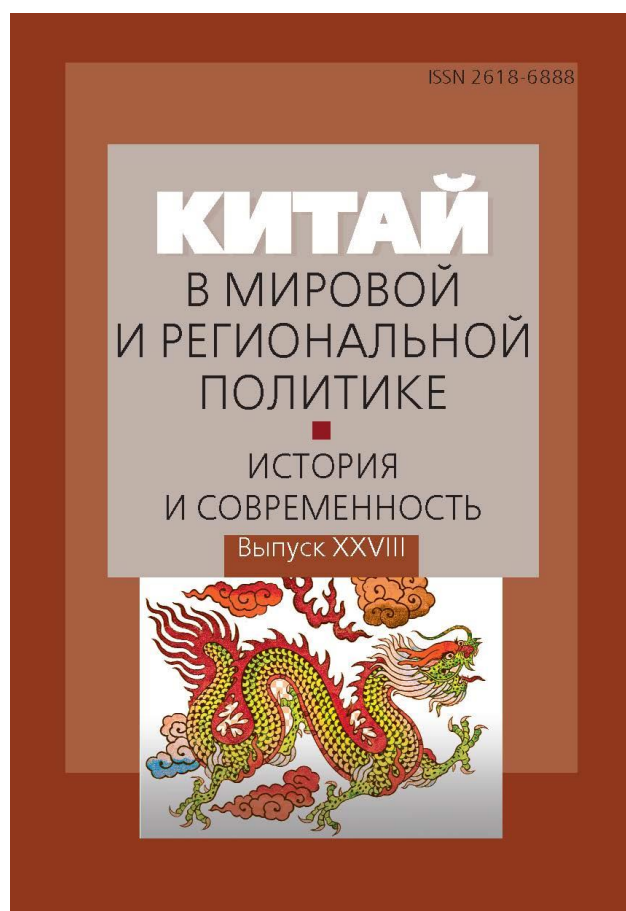
Обложки издания «Китай в мировой и региональной политике. История и современность»: первый выпуск 1996 г. и выпуск 2023 г.