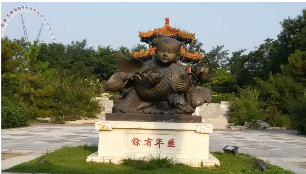
Фото 5. Символ-пожелание «Из года в год изобилие», г. Цзинань.

В парковой культуре присутствуют традиционные символы, связанные с детством: например «Год за годом изобилие», в котором заложен синкретический посыл. Образ «толстого младенца» символизирует глубокое чувство благополучия семьи, которое зависит от детей или отражается в них 2 ; рыба воплощает процветание, семейную гармонию, удачу и успех; лотос рядом с ребёнком означает изобилие для семьи из года в год. Таким образом сочетание «толстый младенец», «лотос» и «рыба» подразумевает множество благоприятных пожеланий и является одним из самых популярных в народной культуре (фото 5).