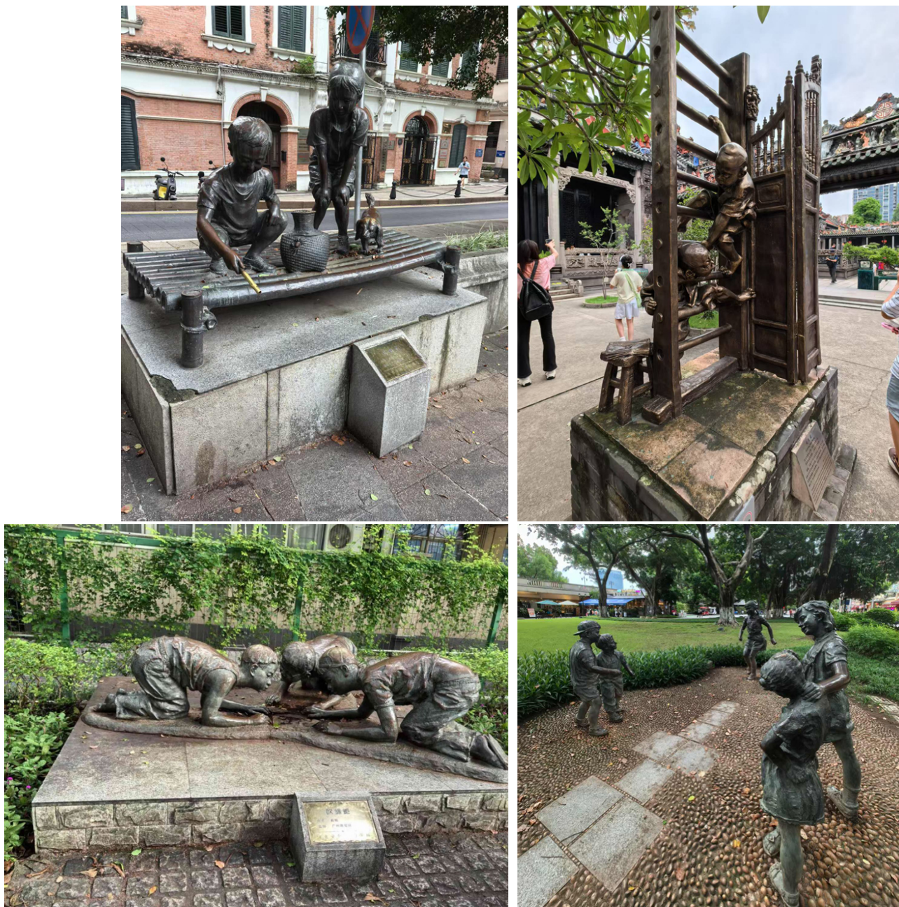
Фото 20, 21, 22, 23. Игры детей. г. Гуанчжоу. Photos 20, 21, 22, 23. Children playing. Guangzhou.

Для полноты описания скульптурных композиций в пространстве парков и городов Китая следует отметить ряд соотнесённых с ними особых «ментальных посылов», адресованных окружающим.