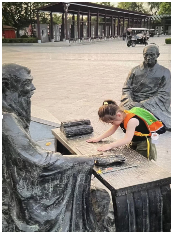
Фото 19. Ребёнок просит благословения у Учителя. г. Бочжоу.

Интересно наблюдать, как современные дети относятся к подобным скульптурам, в частности, к изображениям известных Учителей, к которым они обращаются с большой почтительностью и благоговением, искренне веря в то, что это поможет им в учёбе (фото 19).