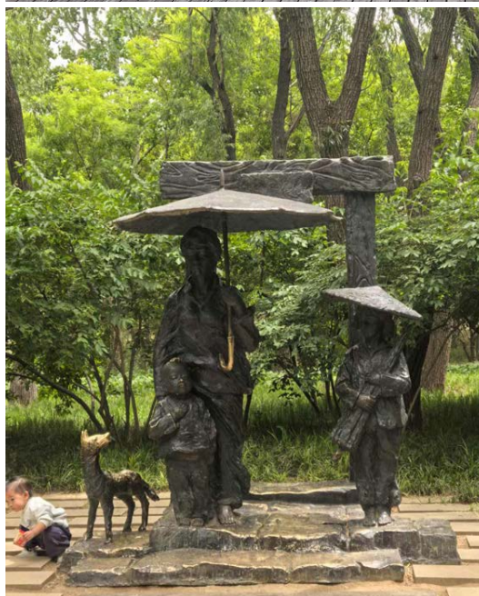
Фото 13, 14, 15, 16, 17, 18. г. Лицзян, г. Гуанчжоу, г. Лицзян, г. Пекин, г. Дэчжоу, г. Цзинань.