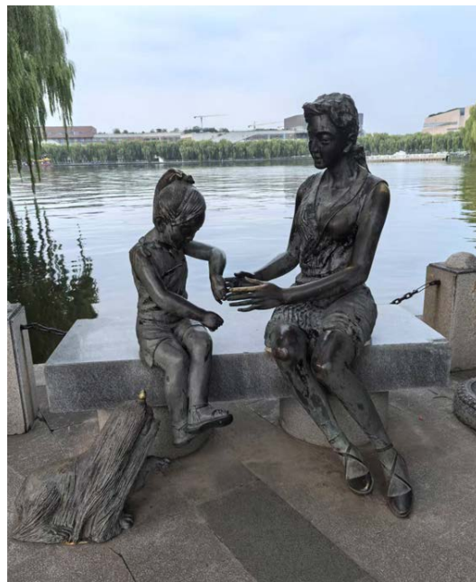
Фото 6, 7. «Мать и дитя», г. Санья, г. Цзинань. Photos 6, 7. “Mother and child”. Sanya, Jinan.