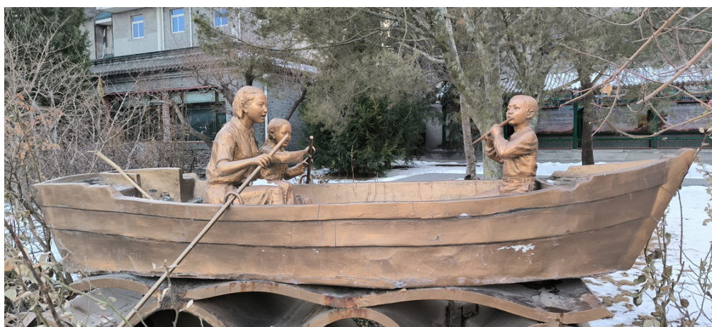
Фото 8. «Мама с детьми в лодке». г. Пекин. Photo 8. “Mother with children in a boat”. Beijing.