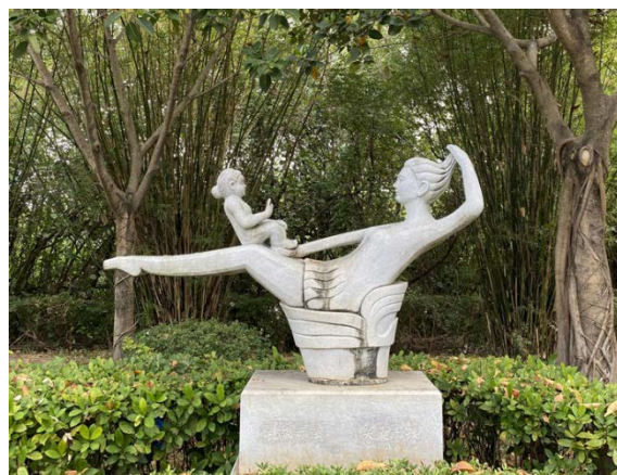
Фото 9, 10. «Мать и дитя», г. Санья. Photos 9, 10. “Mother and child”. Sanya.