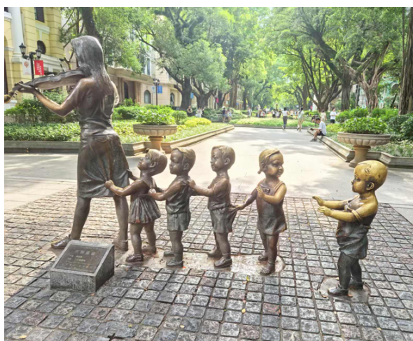
Фото 24. Гуанчжоу. Photo 24. Guangzhou.

Иносказательность скульптурных изображений подчёркивает традиционное обращение к социальной стороне жизни китайцев, отражая идеологию, обычаи и мировоззрение, характерные для изображаемого исторического периода или для времени их создания. Сравним две фотографии (фото 24 и 25):