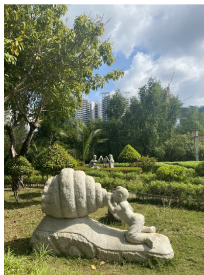
Фото 1, 2, 3. Примеры скульптур на тему детства, г. Дэчжоу, г. Куньмин, г. Санья.

Photos 1, 2, 3. The examples of sculptures on the theme of childhood. Dezhou, Kunming, Sanya.