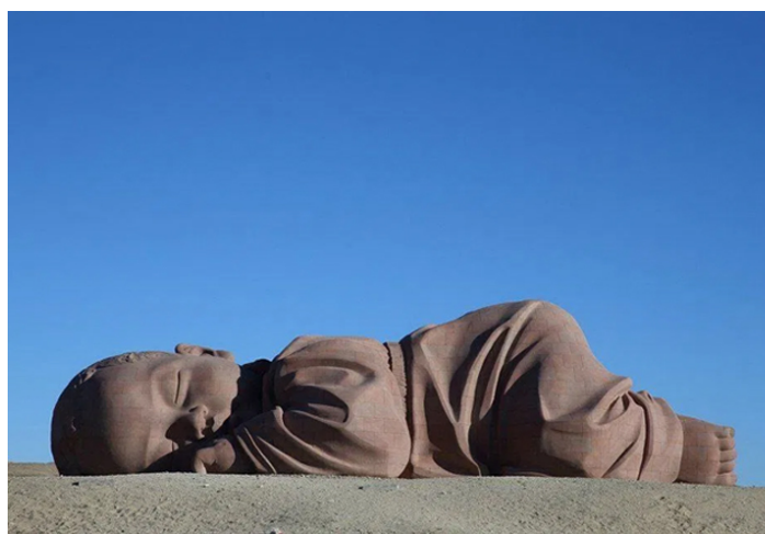
Фото 25. Скульптура «Дитя Земли», Источник: https://sprashivalka.com/questions/025aa9d2/ Photo 25. Sculpture “Child of the Earth” Source: https://sprashivalka.com/questions/025aa9d2/

На фото 24, сделанной в европейском квартале Гуанчжоу, зафиксирована традиционная воспитательная ситуация XIX–XX вв. – «детовожделение», что отражает педагогический принцип импринтинга («следуй за мной, делай, как я»). На фото 25 представлена известная скульптура «Дитя Земли» (2017), расположенная в пустыне Гоби. Автор – профессор Дун Шубин (Dong Shubing), член Китайского союза скульпторов и Китайского общества искусства. Скульптура огромного спящего младенца символически выражает связь человека с нашей планетой как отношения ребёнка и матери. В этом сопоставлении можно