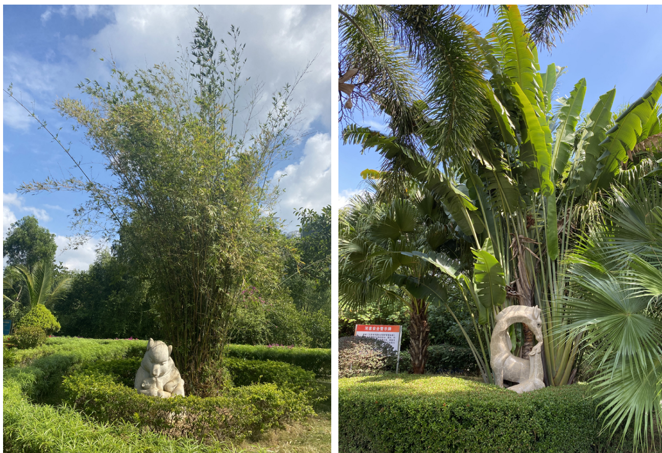
Фото 11, 12. Анимализм детской семантики, г. Санья. Photos 11, 12. Animalism of children's semantics. Sanya.

Анимализм «мать и дитя». Такие сюжеты представлены в композициях детского парка г. Санья. В них можно «прочитать» и нежное общение мамы с малышом, и бережное прикосновение, и игривость. Подобные образы позволяют провести наглядную параллель гармоничной связи матери и ребёнка не только среди людей, но и животных. Ненавязчиво и трогательно детям демонстрируется любовь в мире животных и формируется представление о единстве человека и природы. Таким образом, без слов и излишнего менторствования закладываются основы экологического сознания (фото 11, 12).